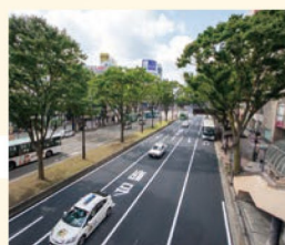
7 青葉通 仙台駅から仙台城址に向かう大きな通り。ケヤキ並木がきれいです。