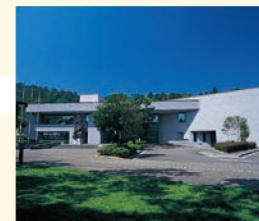
9 仙台市博物館 国宝、慶長遣欧使節関係資料や、重要文化財の伊達政宗所用具足・陣羽織など、仙台伊達家からの寄贈資料をはじめ、江戸時代の仙台藩に関わる歴史・文化・美術工芸資料など約9万点を収蔵。