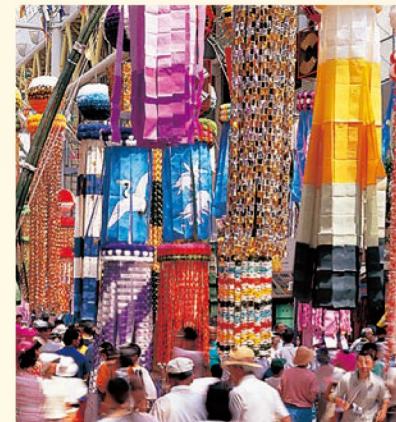
仙台七夕まつり 8月6～8日開催の仙台七夕まつり。手作りの七夕飾りが中心部のアーケードや商店街を埋め尽くします。