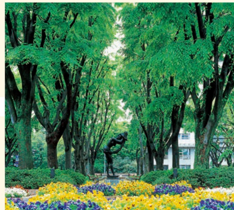
3 定禅寺通 春から夏にかけてはケヤキ並木の新緑、冬は光のページェントが楽しめる通り。