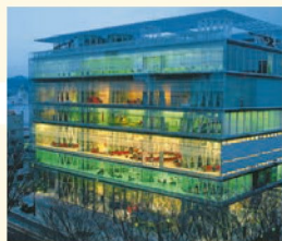
8 せんだいメディアテーク 図書館やギャラリー、カフェが集結したカルチャー・スポット。建物も個性的でかっこいい!