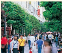
6 一番町四丁目商店街 広瀬通と定禅寺通の間のショッピングスポット。三越などの大型百貨店もあります。