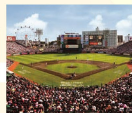
10 楽天生命パーク宮城 プロ野球チーム「東北楽天ゴールデンイーグルス」の本拠地。野球観戦はもちろん一日中満喫できるボールパークを体感しにしよう!