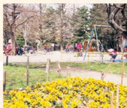
15 榴岡公園 仙台のお花見のメッカ。仙台市街地の代表的な公園のひとつ。