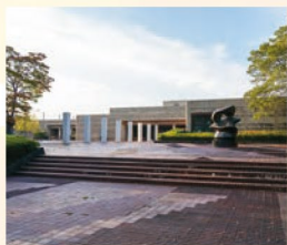
13 宮城県美術館 宮城県や東北ゆかりの作家や海外の芸術家の作品を展示。庭もとても個性的でステキ!