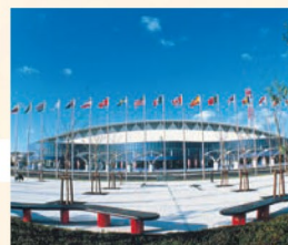
みやぎ産業交流センター(夢メッセみやぎ) 仙台港にある東北最大の展示施設。毎年いろいろなビッグイベントが開催されます。