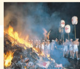
どんと祭 正月の松飾りなどを燃やす祭り。祭りの日は市内のあちこちで裸参りの人を見かけます。