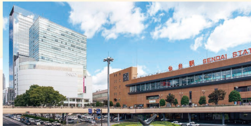
1 JR仙台駅 仙台の玄関口。ペDESTリアンデッキと呼ばれる歩道があり、本校への通学もスムーズ。