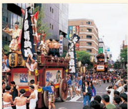
仙台青葉まつり 5月に行われる祭り。市民参加のすずめ踊りや武者行列、山鉾巡業など見応えあり。