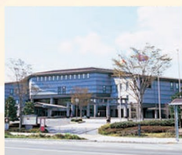
5 仙台国際センター 留学生をサポートしてくれるセンター。国際会議場もあります。