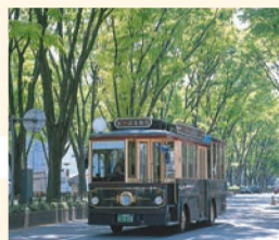
るーぶる仙台 仙台城址や博物館などの観光名所を巡るバス。レトロな雰囲気がかわいい。