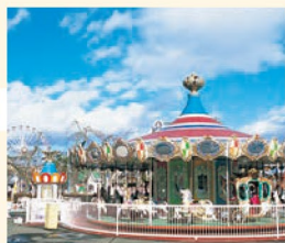
八木山ペニーランド お隣の仙台市八木山動物公園とあわせて、仙台の遠足&デートスポットのひとつ。