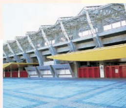
ユアテックスタジアム仙台 プロサッカーチーム、ベガルタ仙台のホームグラウンド。