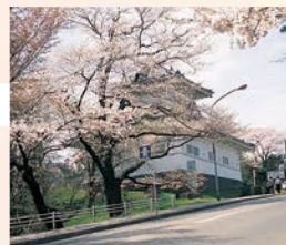
4 仙台城址隅櫓 仙台の街のシンボルといえる仙台城址。