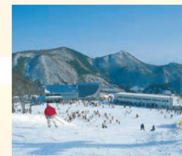
泉高原スプリングバレースキー場 仙台市郊外、泉ヶ岳にあるスキー場。ウィンタースポーツにも挑戦しよう!