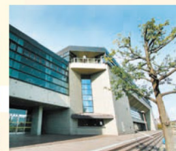
カメイアリーナ仙台(仙台市体育館) 仙台のプロバスケットチーム SENDAI 89ERS (エイティナイナーズ) の試合も行われる体育館。地域密着型のスポーツ文化で仙台の元気を一気に盛り上げよう。