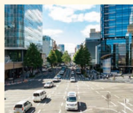
12 広瀬通 市街を東西に走るイチョウ並木の広瀬通。