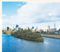
14 広瀬川 仙台市民にやすらぎと潤いを与える清流。