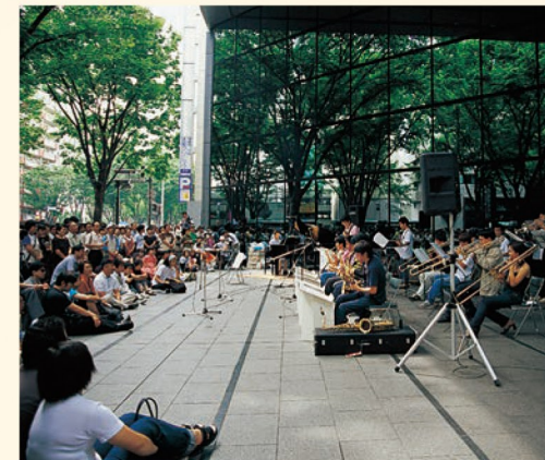
定禅寺ストリートジャズフェスティバル in SENDAI 公園や広場をステージに、だれもが参加でき、気軽に楽しめる音楽祭。全国的なビッグイベントです。ジャズに限らず、あらゆるジャンルの音楽が集い、初秋の杜の都を音楽で鮮やかに彩ります。